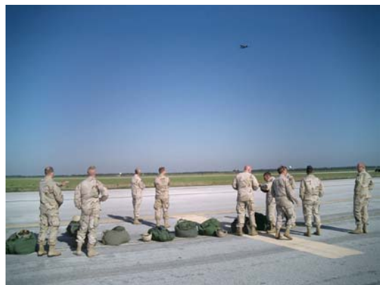
Første hold vel nede

Nu foregik det hele jo på MacDill Air Force Base, og sådan et sted er der en hulens masse landingsbane, rullebaner og hvor de eller kan finde på at smide beton, og dem kom jeg i nærkontakt med. Endvidere var der metalsøjler som forhindringer, store afvandingskanaler og mange andre sjove (ubehagelige) forhindringer, som vi for øvrigt blev advaret imod. Exit højden var 600 m. Selv om jeg før havde prøvet at forlade en C-130’er, og godt viste at det var et ordentlig ”blast”, der mødte en udenfor. Vel ude og kontrolleret at skærmen var udfoldet, var det tid til lidt orientering. Jeg havde på forhånd studeret landingsområdet på en luftfoto, men det tager nu lidt tid at sammenfatte ”real life” og foto. Jeg fik da konstateret hvor jeg befandt mig og fik også spottet landingsområdet, der var et godt stykke bag mig. Det var for så vidt også godt nok, idet jeg fløj hurtigt baglæns og således ville komme hen til landingsområdet. Der var bare det, at, mellem mig og landingsområdet var der 4 beton rullebaner, og i en rund skærm der fløj baglæns var jeg ikke spor i tvivl om, at lande der var ikke det mest smarte. Højdemåleren vist nu 100 m, og fra denne højde har man jo fået banket ind i knolden, at nu foretager man ikke store svingærinder. Nå, men de 3 første baner passerede fint under mig, men ved mødet med den 4. var jeg udgået for højde, og der var så ikke andet end at gøre klar til rullefald. Jeg erfarede, at det skal man ikke gøre for tidligt, - det giver et lidt skæv møde med