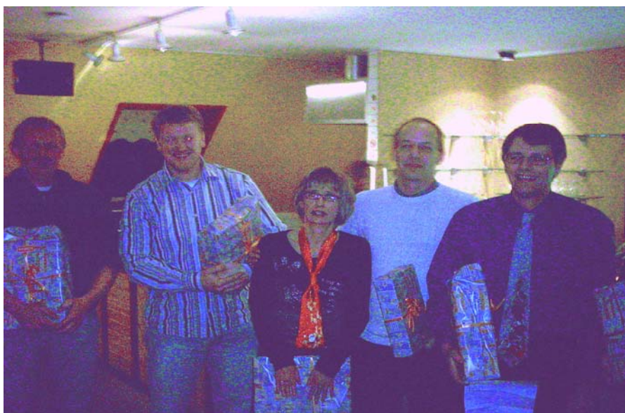
Billedet viser de deltagende par i finalen pulje 1.